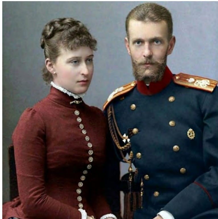
Великая княгиня Елизавета Фёдоровна и великий князь Сергей Александрович.

После 7 долгих лет счастливой нашей супружеской жизни <...> мы должны начать совершенно новую жизнь и оставить нашу уютную семейную жизнь в городе. Мы должны будем так много сделать для людей там, и в действительности мы будем там играть роль правящего князя, что будет очень трудным для нас, так как вместо того, чтобы играть такую роль, мы горим желанием вести тихую личную жизнь».